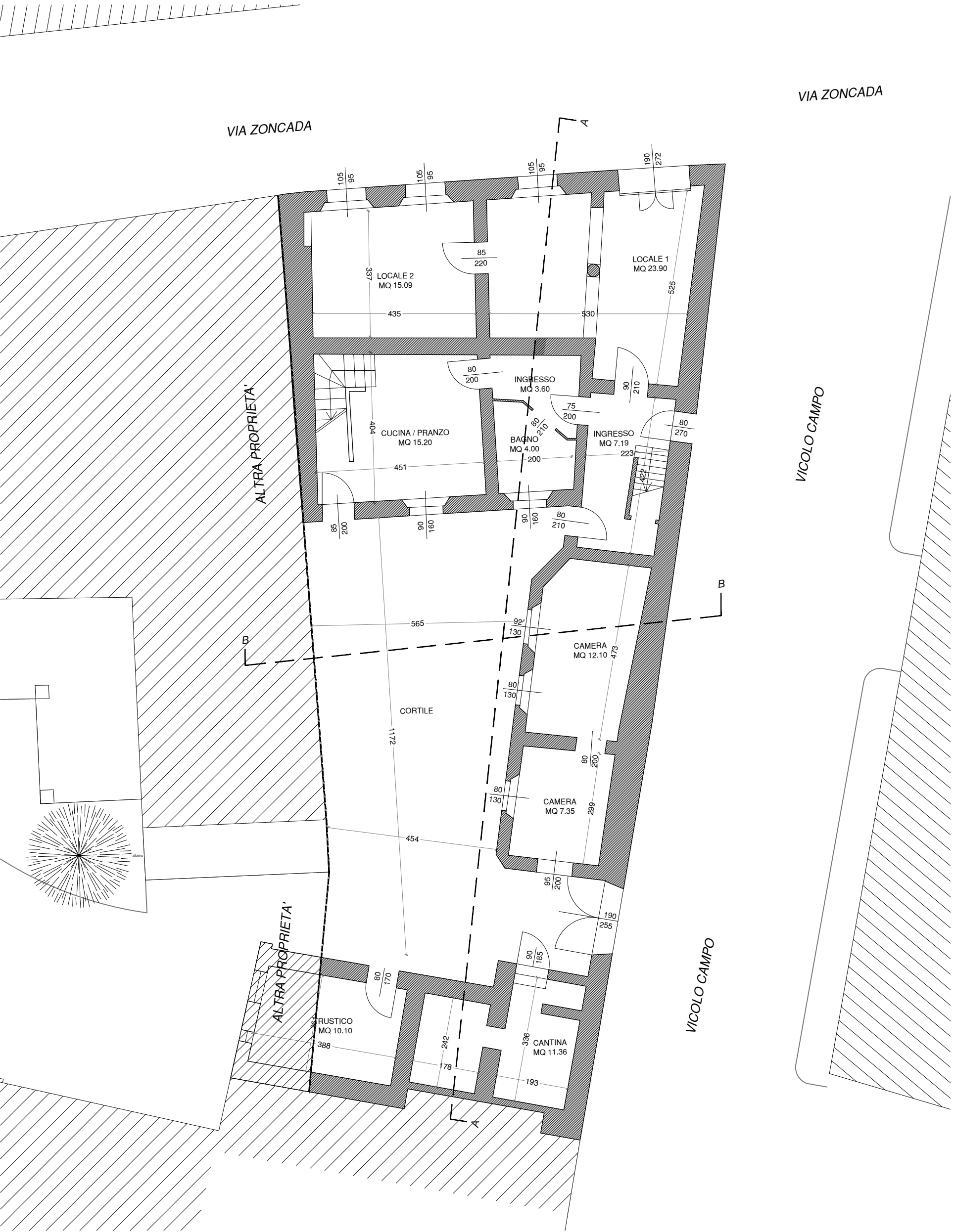
PLANIMETRIA PIANO TERRA